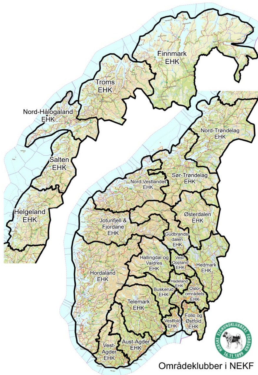
Områdeklubber i NEKF

Et nytt områdekart er utarbeidet av NEKF